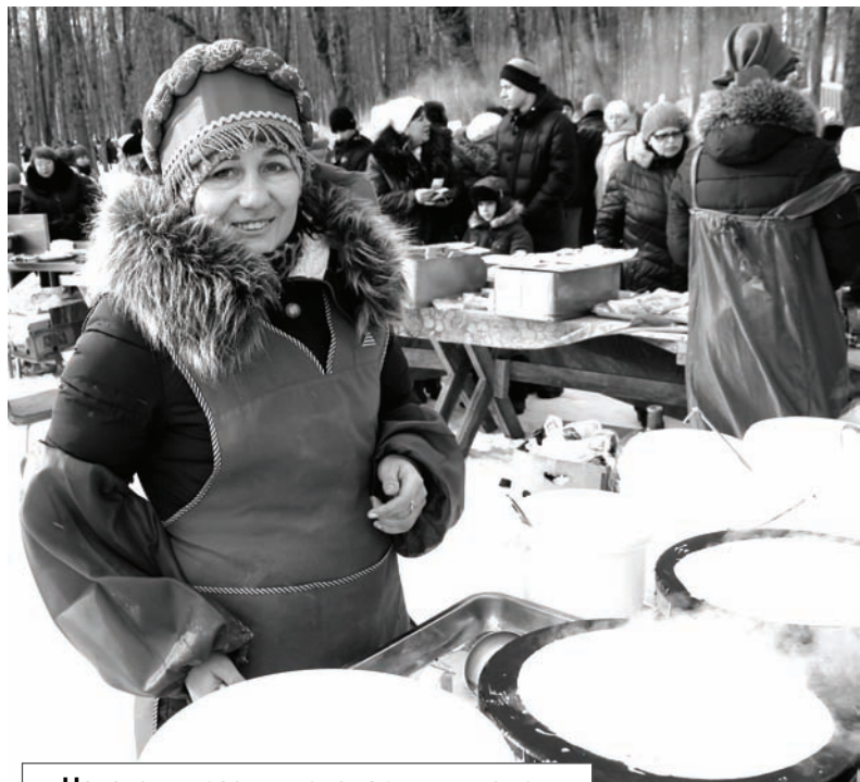
На этом празднике сварили и съели 100 литров ухи и испекли сотни блинов

По материалам пресс-службы районной администрации