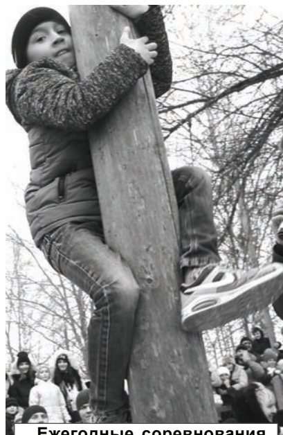
Ежегодные соревнования по столболазанию вновь собрали и самых ловких, и самых настырных