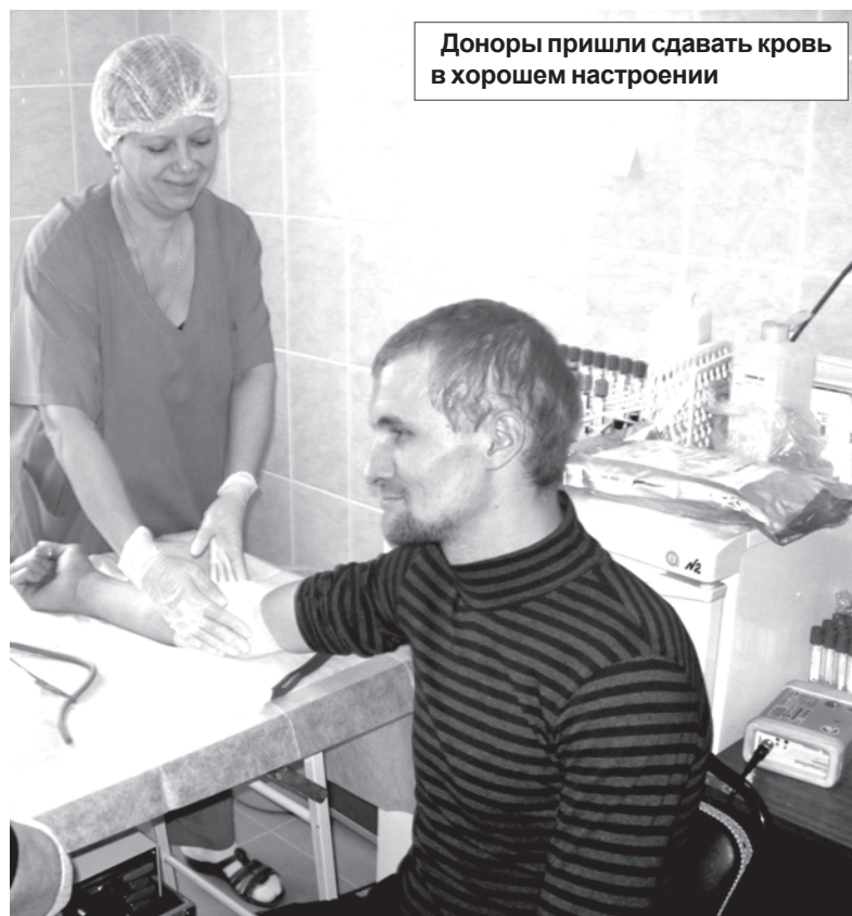
Доноры пришли сдавать кровь в хорошем настроении

Желающий сдать кровь приходит в донорский пункт и первым делом заполняет анкету. При себе обязательно нужно иметь паспорт, поскольку все личные данные донора вносятся в так называемую донорскую базу. Только после этого выдается специальная донорская карта.