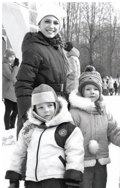
Было на что посмотреть и юным, и взрослым гостям праздника