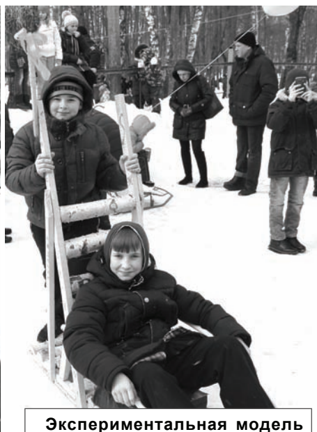
Экспериментальная модель «Чудо-сани» проходит испытание