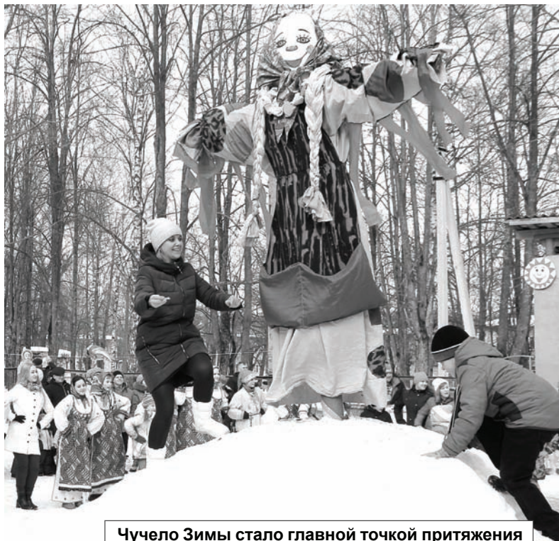
Чучело Зимы стало главной точкой притяжения

Весь день в парке проходили праздничные гуляния. Работали торговые ряды, сувенирные лавки. Все желающие могли угоститься блинами, ухой, шашлыком, горячим чаем.