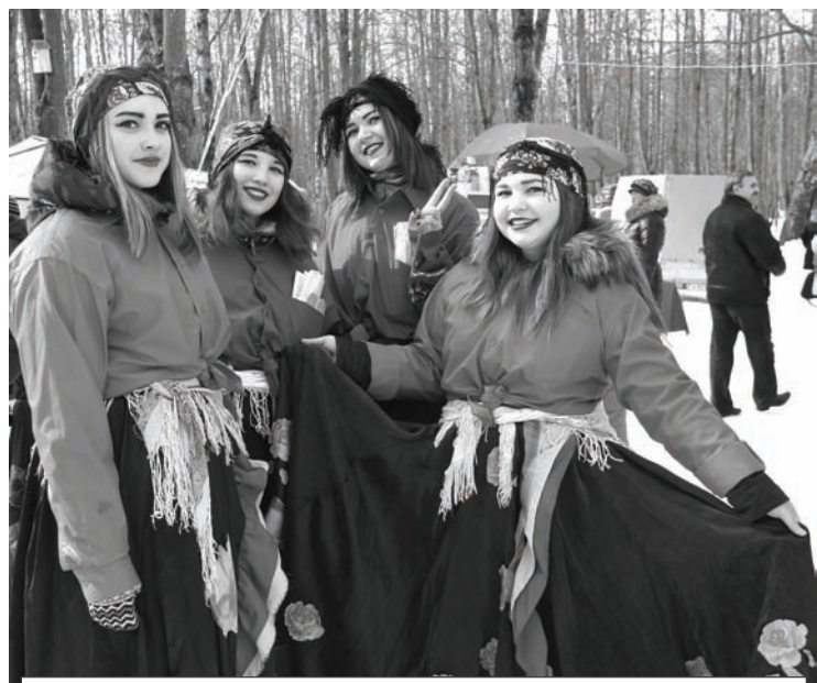
Ярцевские красотицы 21-го века на древнерусском празднике

26 февраля в парке культуры и отдыха прошли праздничные мероприятия, посвященные прощанию с Масленицей